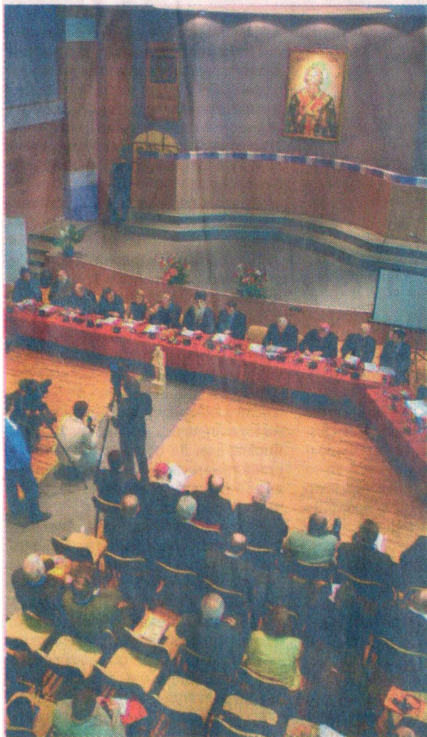
Научни скуп поводом великог хришћанског јубилеја

Ниш – Јубилеј доношења Миланског едикта, којим је император цар Константин Велики забранио прогон хришћана и дозволио верску равноправност на територији Римског царства, биће највећи догађај у култури и духовном погледу који ће подсетити на хришћанске корене и темеље цивилизације у Европи. Ово је закључак учесника прве међународне конференције уочи прославе 1.700 година Миланског едикта у пролеће 2013., која ће бити одржана у Нишу, месту рођења Константина Великог, али и у великом броју европских градова. Говорећи на скупу епископ бачки Иринеј истакао је да нас Милански едикт подсећа на потребу духовног јединства јер економска компонента без духовне није довољна да би јединство било остварено.